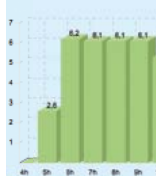
Erzeugte elektrische Energie (in kWh) im Tagesverlauf

Sie verbrauchen viel Strom? – Dann erzeugen Sie ihn doch einfach selbst!