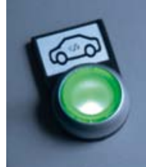
Bereit für die Zukunft: „Tanken“ Sie Ihr Elektro-Fahrzeug mit eigenem Strom.

Unser Kraftpaket passt in jeden Heizungskeller und leistet in vier verschiedenen Größen zwischen 2,6 und verblüffenden 7,2 kWh Strom.